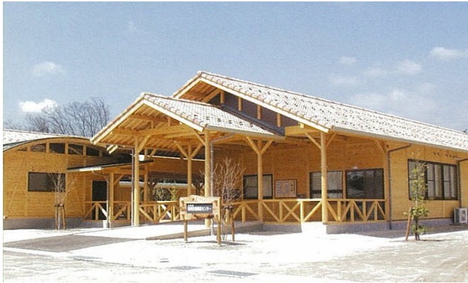
飯田市産業経済部工業課

飯田市では、地域内の人・企業の新事業展開のための支援を目的として、環境産業公園内に飯田市環境技術開発センターを設置しています。現在、1室の空きがありますので、新規入居者募集を行います。