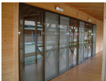
『通路から見た交流室』